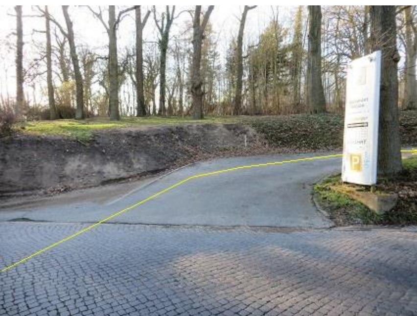
Auffahrt zum Restaurant „Radeberger“-