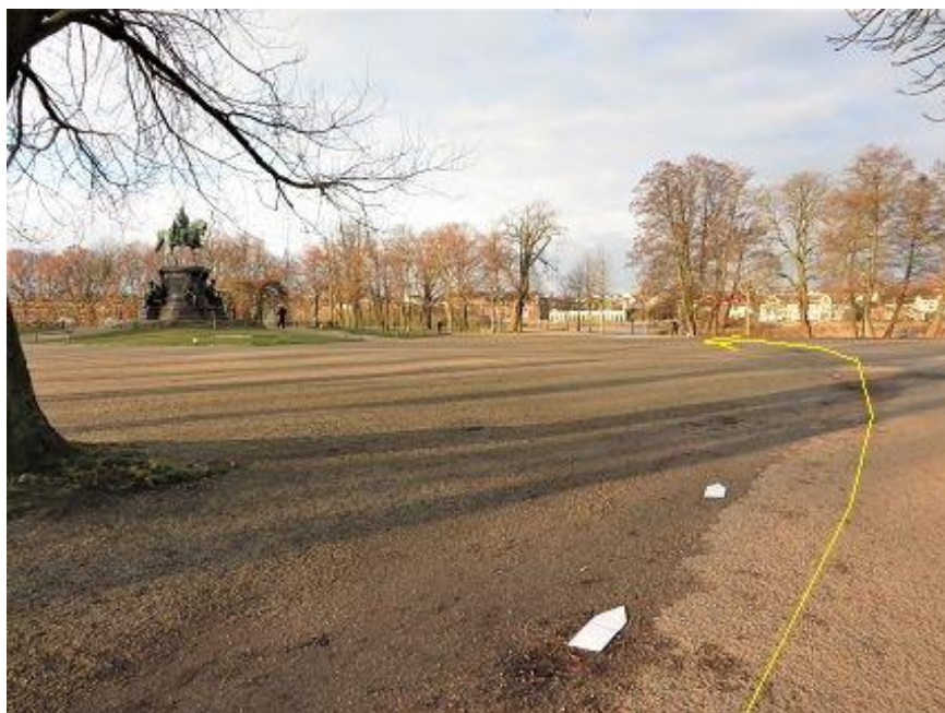
Reiterstandbild: Herzog Friedrich Franz II.