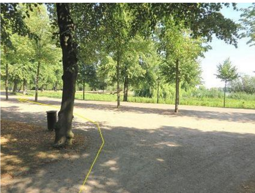
Ende Birkenweg Einbiegung auf Lennéstraße