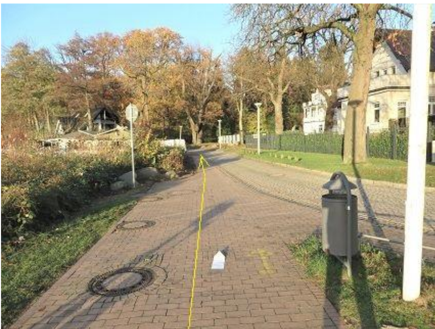
„Am Strand“ Promenade