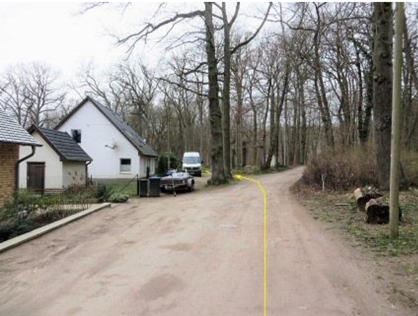
unterer „Waldschulweg“ auf Höhe Haus Nr. 32 (rechts Mast Nr. 29)