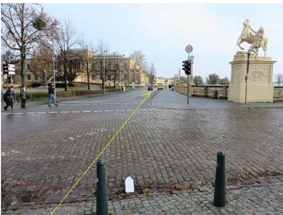
Querung Schlosstraße zur Werderstraße