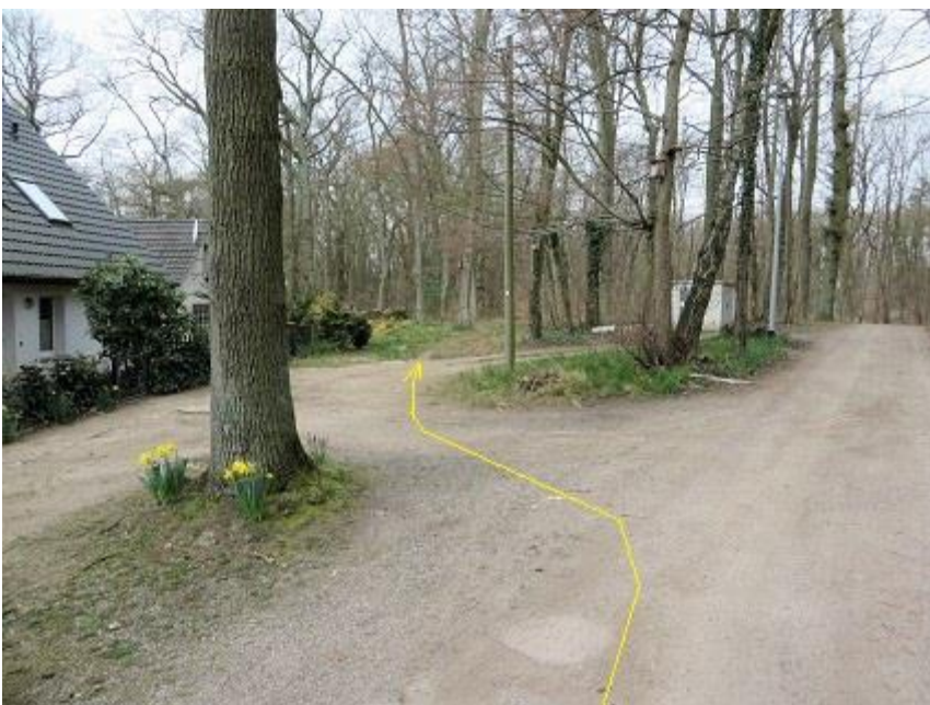
unterer „Waldschulweg“ Höhe Haus Nr. 34 - vor Mast Nr. 30 leicht nach links zum Querungs-Pfad MP 9,84 km