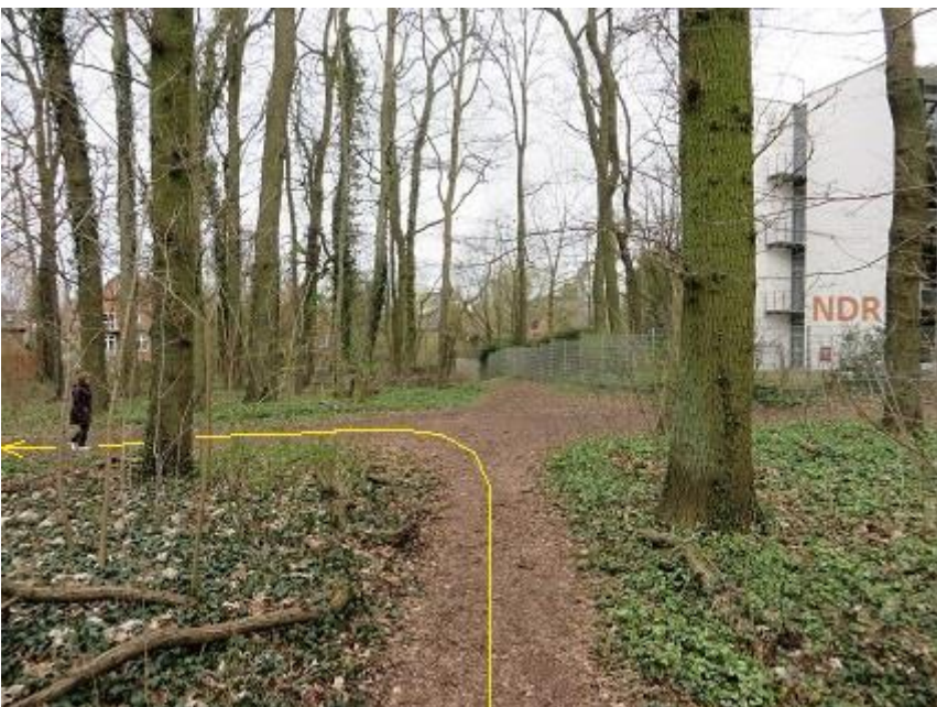
<- Funkhauszaun Ende Querungs-Pfad - Linksabbiegung zum Faulen See MP 10,10 km