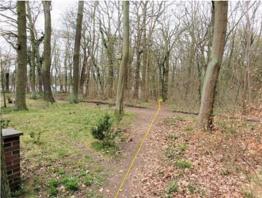
links Ende Grundstück Haus Nr. 36a - weiter zum Querungs-Pfad