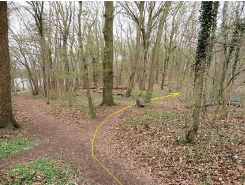
Anfang Querungs-Pfad - rechts weiter - bis zum südlichen Ende des Funkhauszauns MP 9,91 km