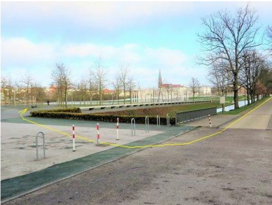
Burgseestraße - Bertha-Klingberg-Platz