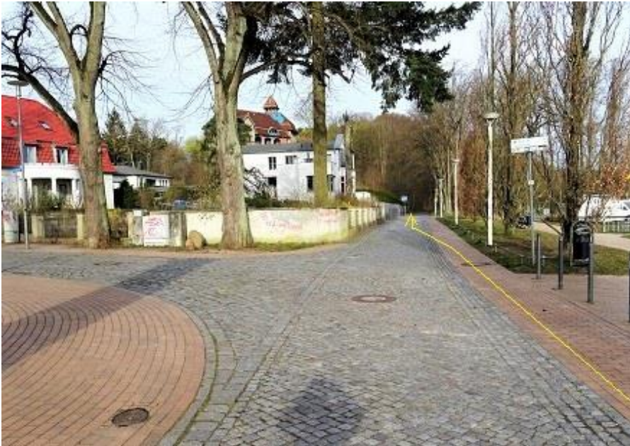
„Am Strand“ - Fahrweg