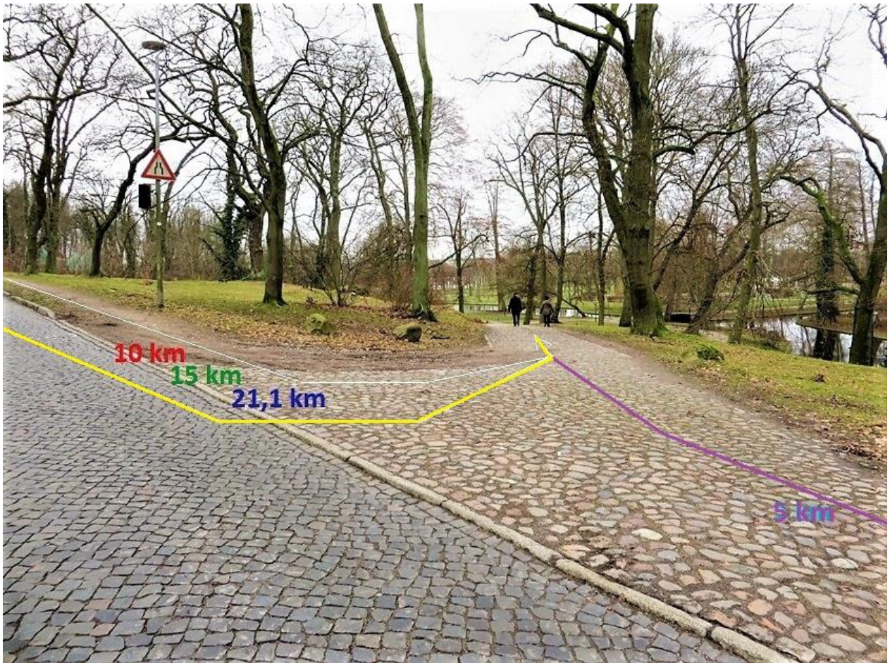
„Schleifmühlenweg“ Einbiegung auf Pflasterweg in den Schlossgarten

(hier Zusammenführung aller Streckenlängen!)