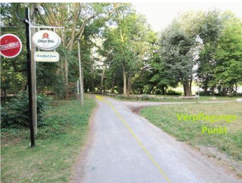
„Gasthof Zoo“ am Hexenberg