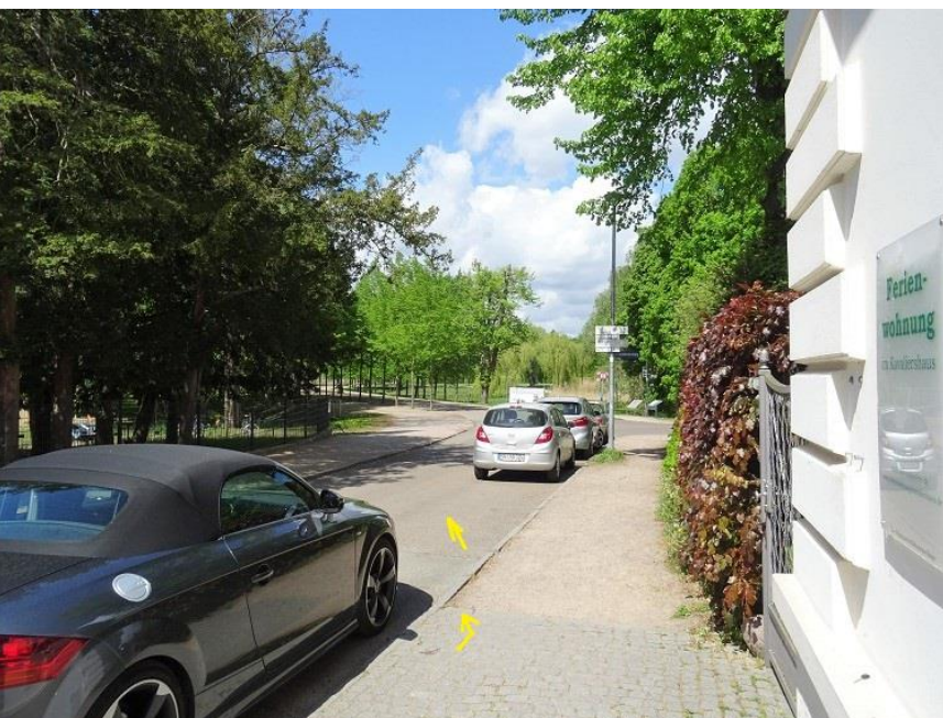
Anfang Schlossgarten Lennéstraße

Auf Höhe Ende Kavaliershaus Querung der Fahrbahn