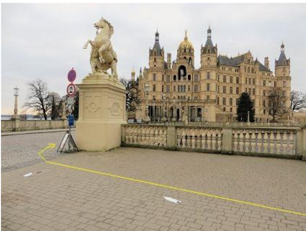
Brücke zur Schlossinsel