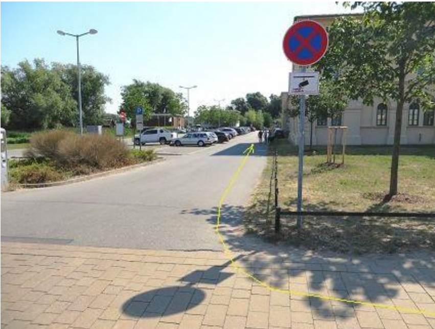
Werderstraße - Abbiegung zur Marstallhalbinsel