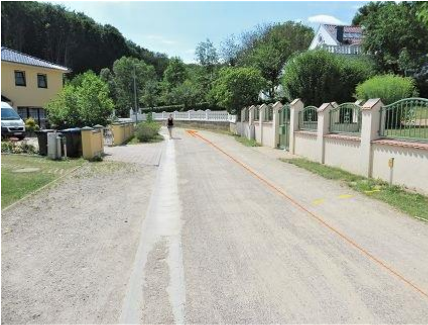
„Mueßer Bucht“ bei Haus-Nr. 2a