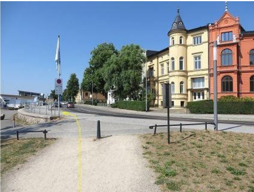
Abbiegung in Werderstraße - zur Schlossbrücke