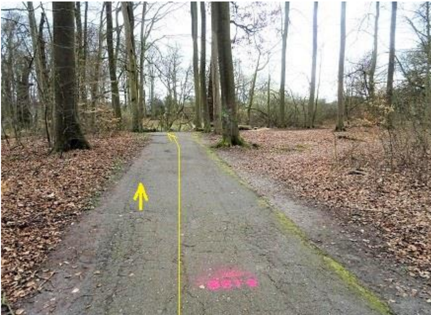
Burg - Asphaltweg