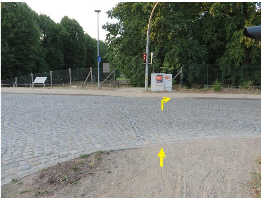
Johannes-Stelling- Straße -

Querung Schleifmühlenweg - Höhe Eingang Freilichtbühne