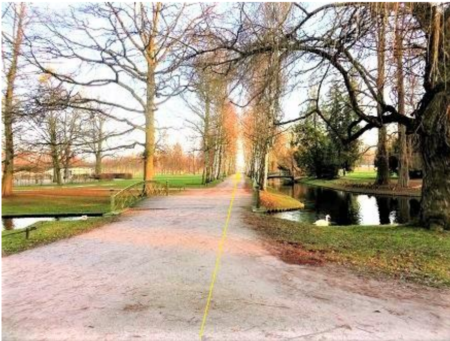
Brücke über Kreuzkanal zum Birkenweg