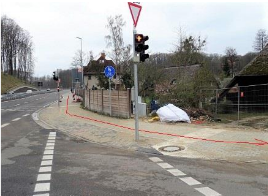
Einbiegung von B 321 in Alte Critzer Landstraße