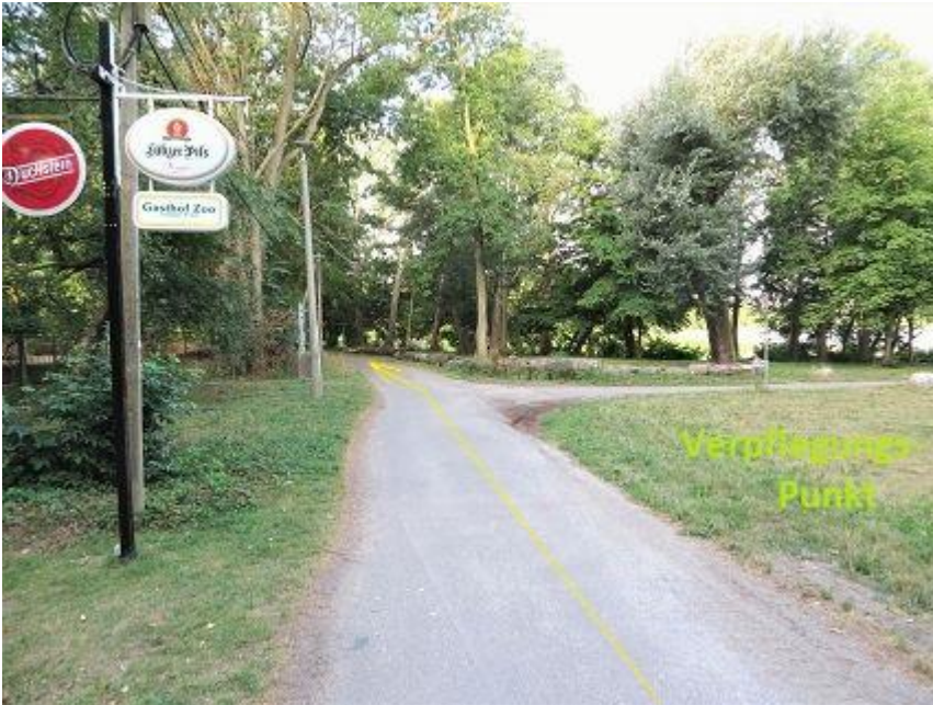
„Gasthof Zoo“ am Hexenberg