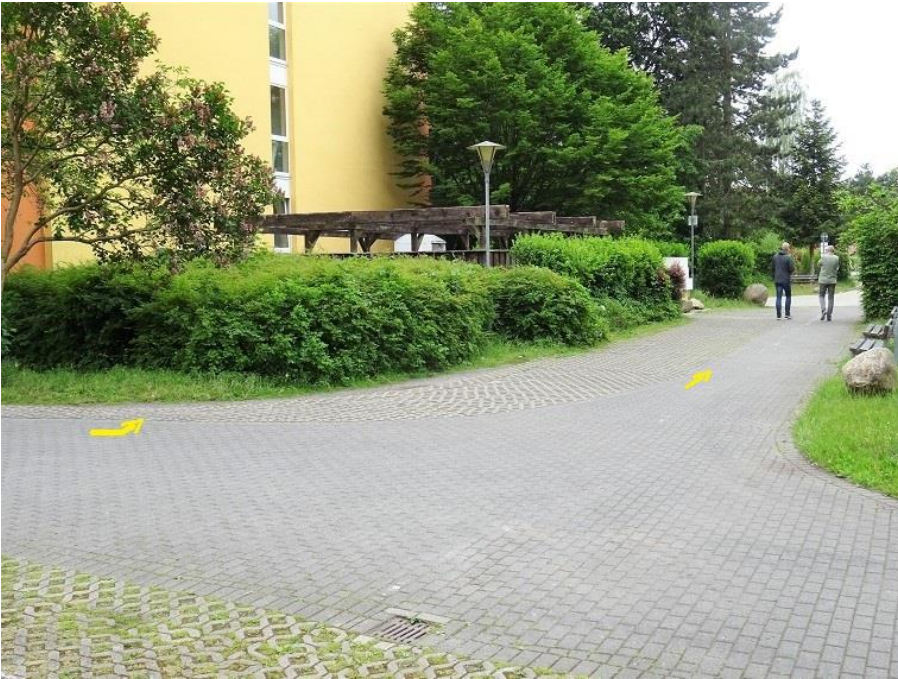
Einbiegung auf Räthenweg