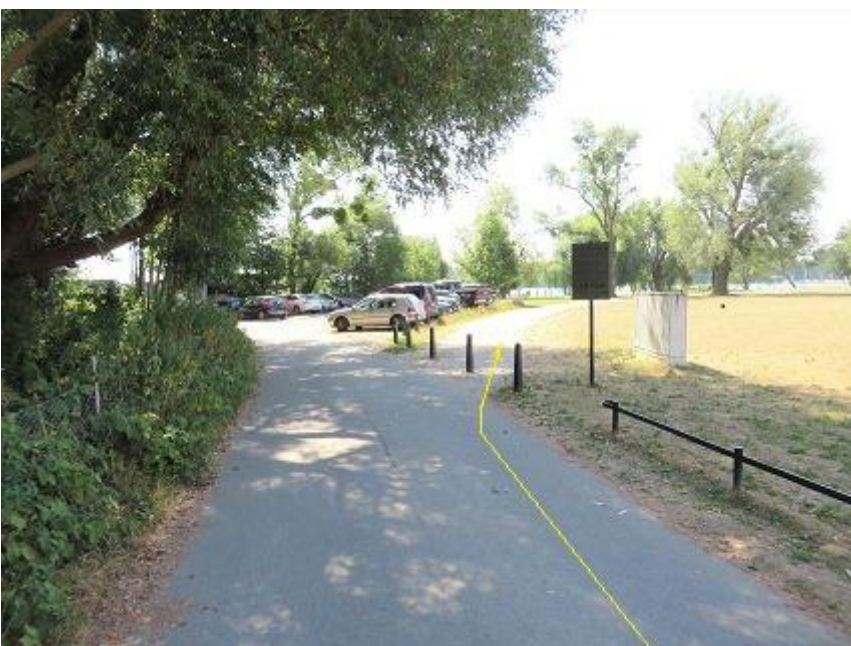
Abbiegung vor Seglerheim zur Marstallhalbinsel-Passage