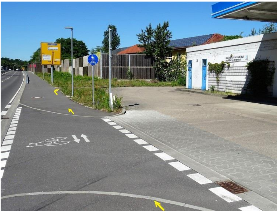
B 321 - Einfahrt ARAL