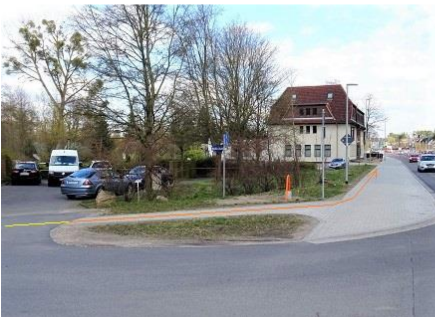
MP 8,81 km (Straßenleuchte 42)