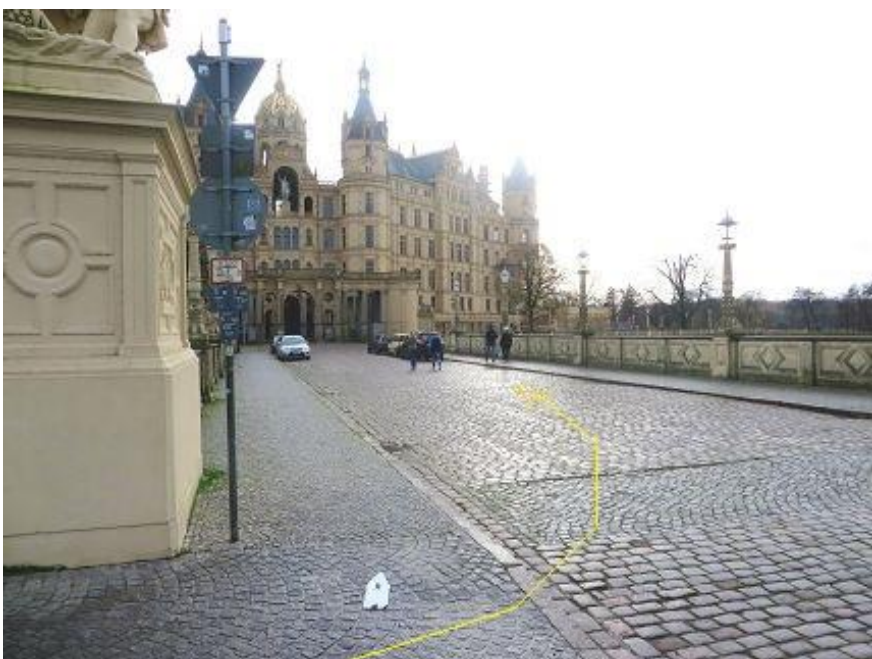
Von Werderstraße - auf Brücke zur Schlossinsel