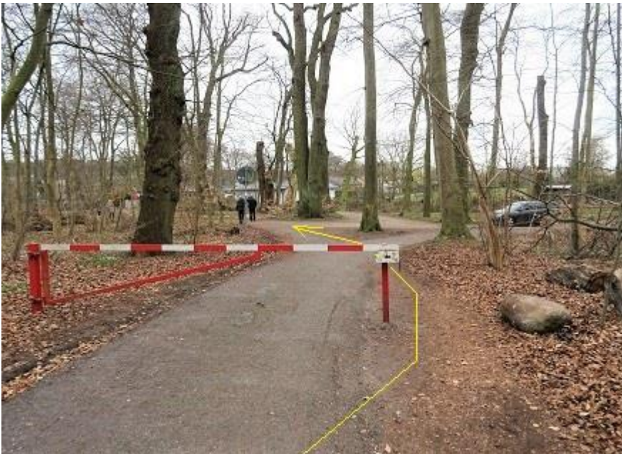
Burg - Asphaltweg