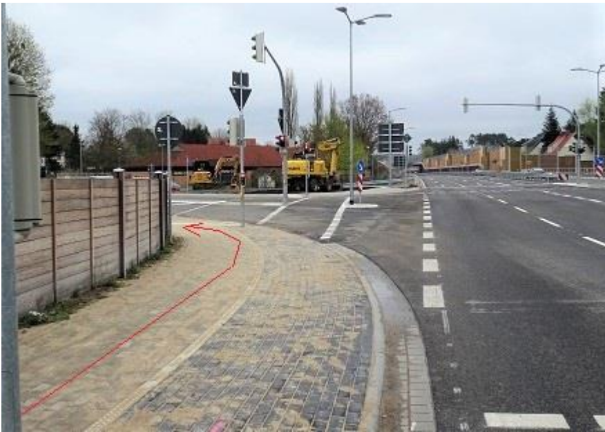
B 321 Geh- / Radweg