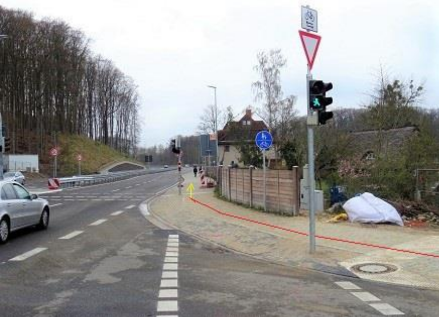
Einbiegung von Alte Crivitzer Landstraße auf Gehweg B 321