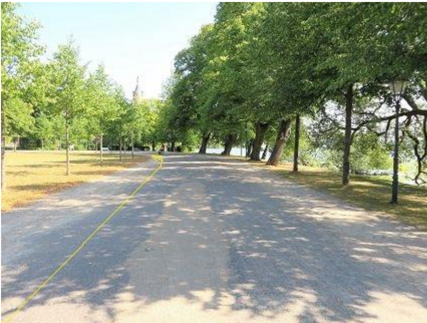
Lennéstraße - Schlossgarten