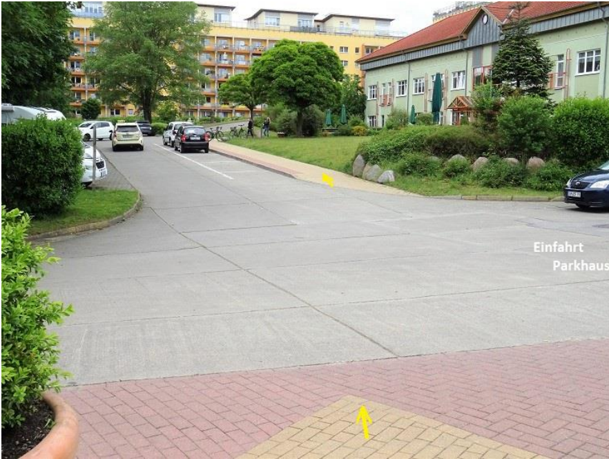
Wohnpark Zippendorf - Querung von Haus 3 (rechts Parkhaus) zum Gehweg -> Haus Nr. 35 - 43