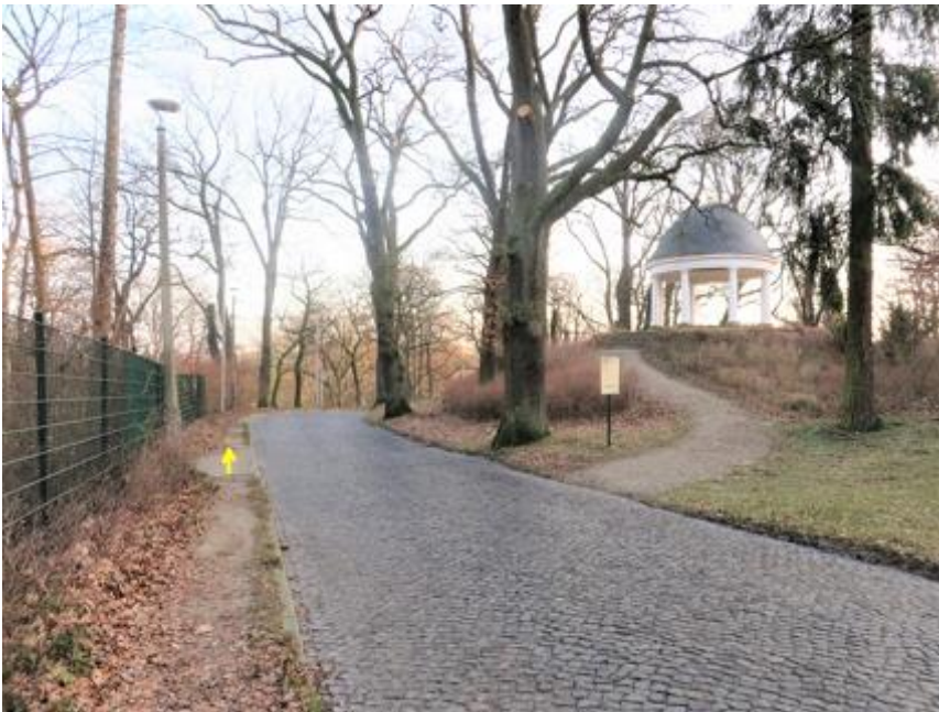
Blick auf Jugendtempel