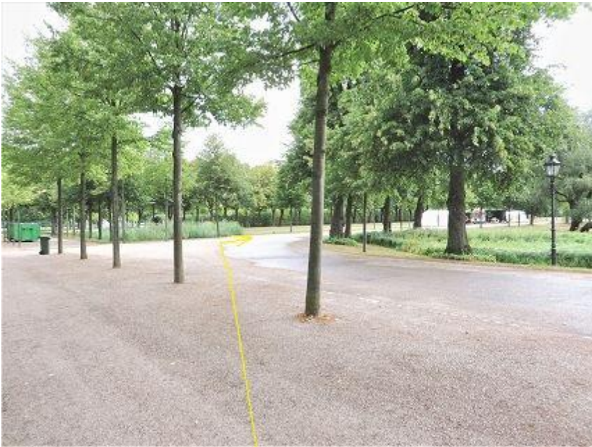
Lennéstraße - Schlossgarten