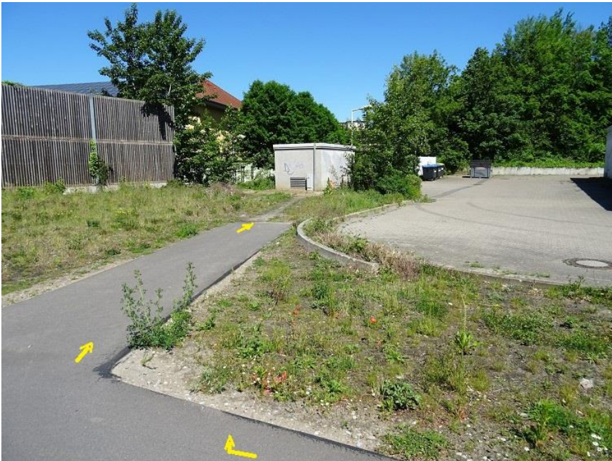
B 321 - Einbiegung auf Weg zum Wohnpark