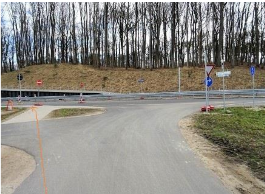
Mueßer Bucht -