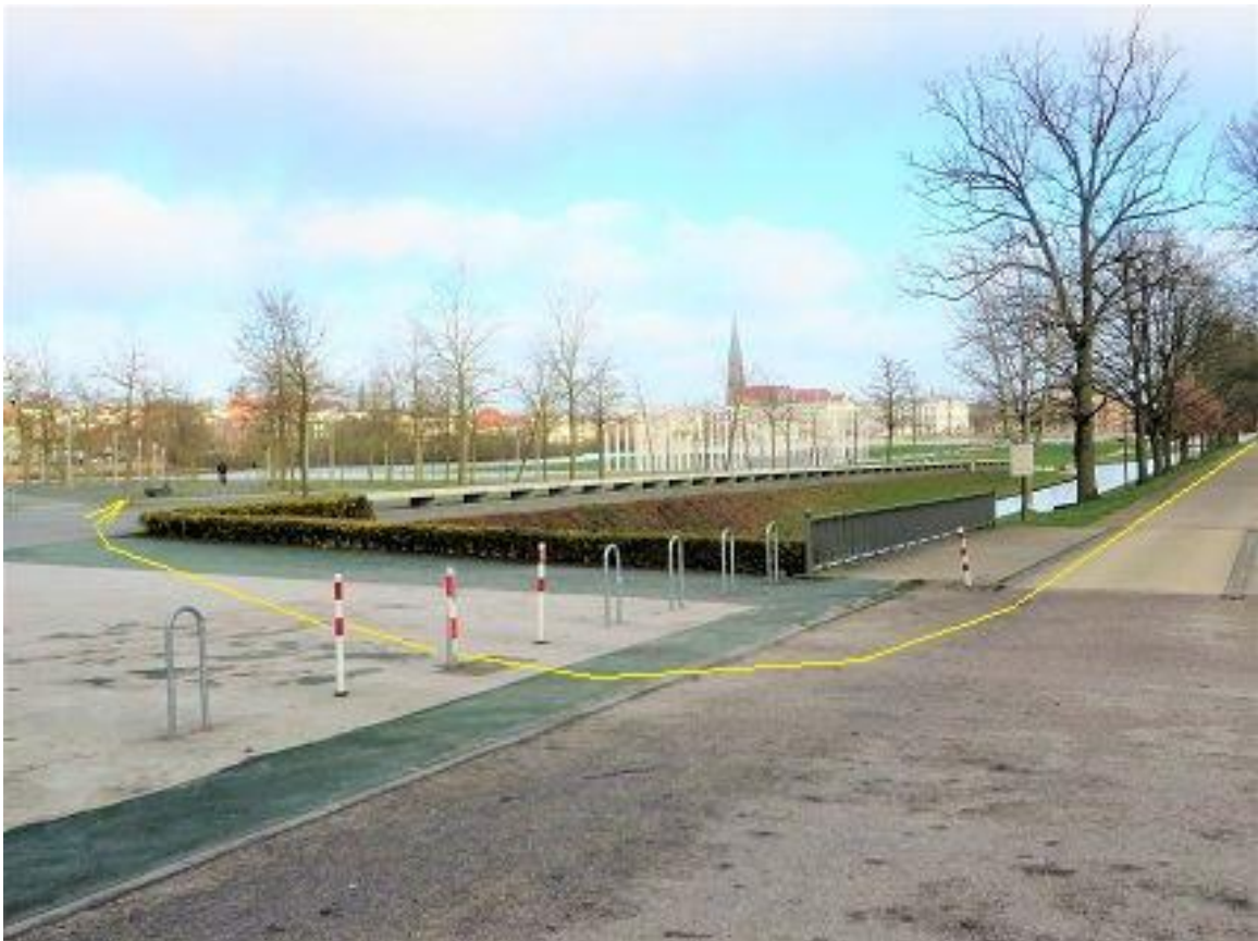
Burgseestraße – Bertha-Klingberg-Platz