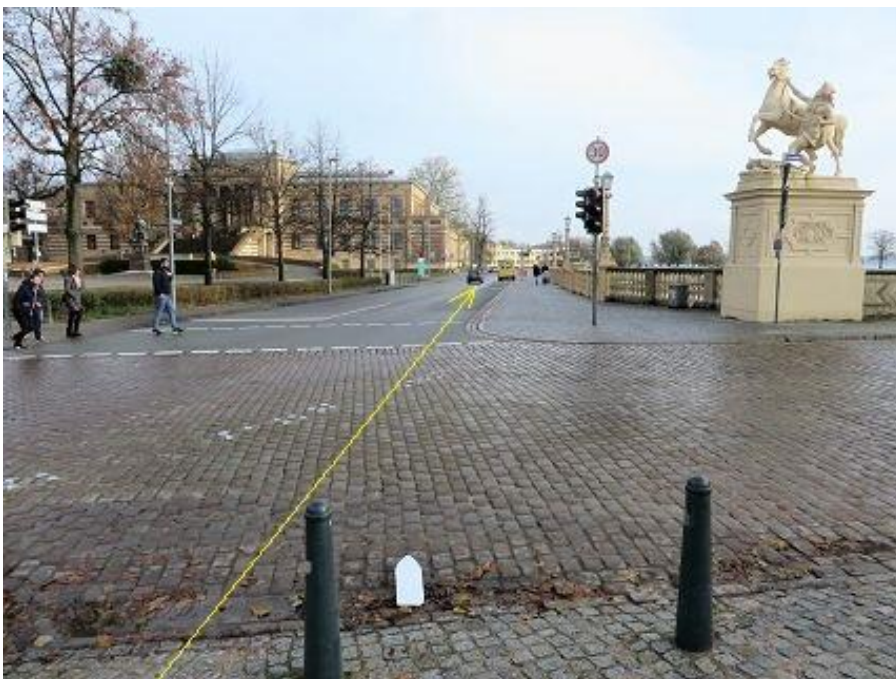
Querung Schlosstraße zur Werderstraße