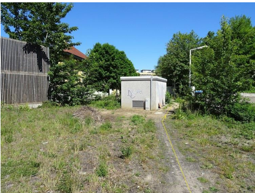
Trafohaus-Pfad zum Wohnpark