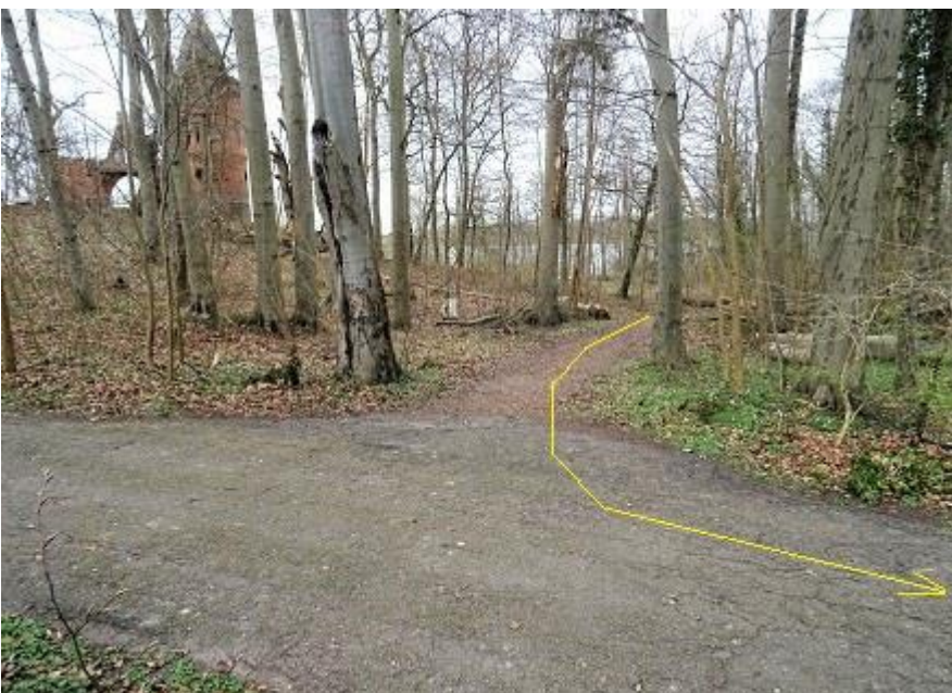
Von Badestelle kommend auf Asphaltweg