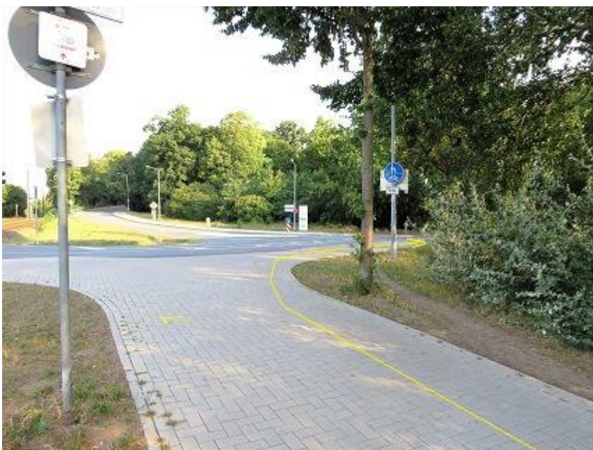
Fauler See - Anfang Lennéstraße