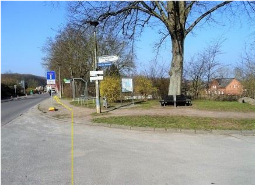
Alte Crivitzer Landstraße - Höhe „Grieche“