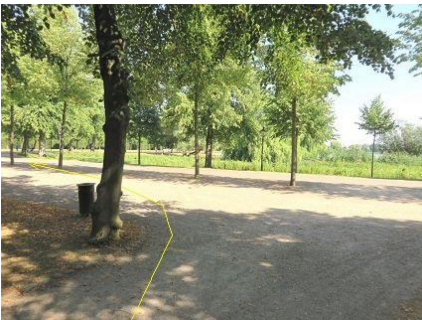
Ende Birkenweg Einbiegung auf Lennéstraße