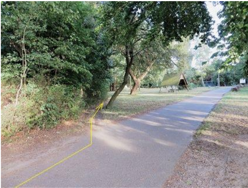
„Schleifmühlenweg“ - Fauler See

Anfang Rastplatz-Dreieck (Nähe Zoo-Gaststätte)