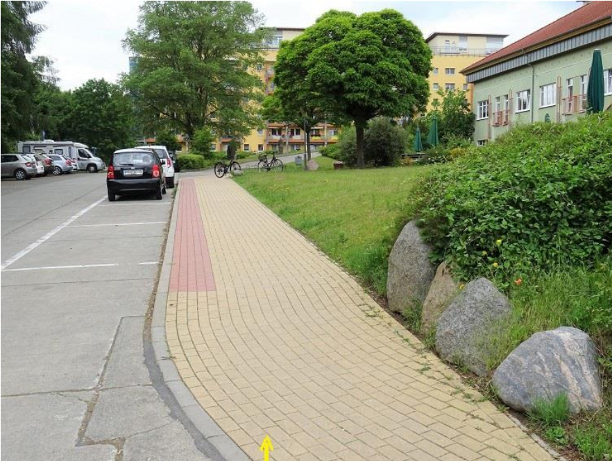
Gehweg -> Haus Nr. 35 - 43