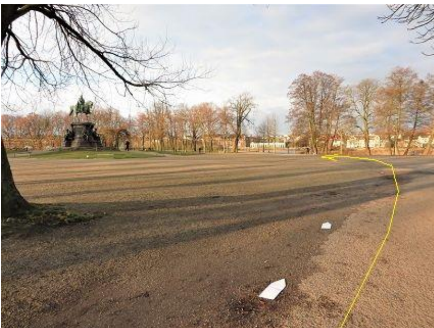
Reiterstandbild: Herzog Friedrich Franz II.