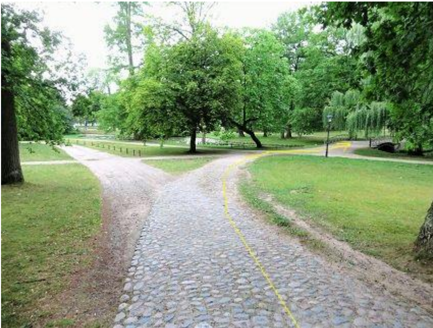
Schlossgarten – Pflasterweg zum Kreuzkanal