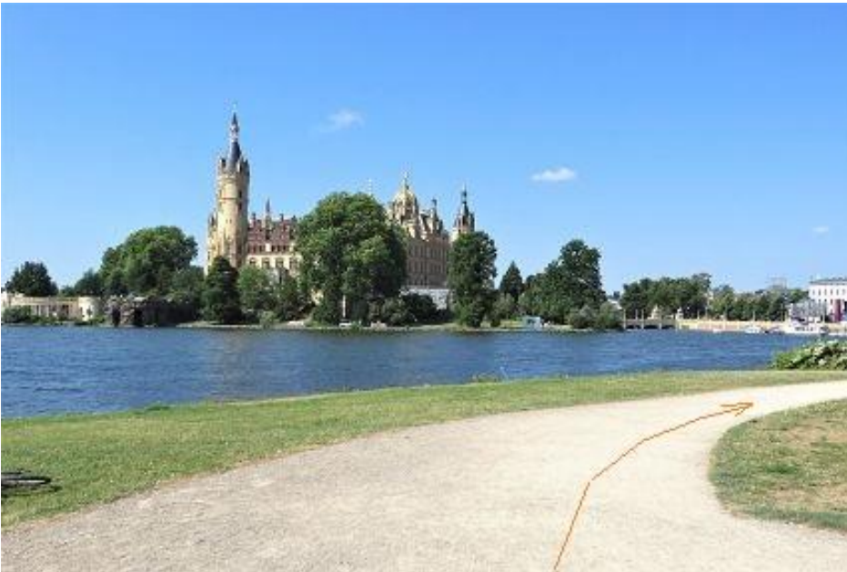
Schlossblick von Marstallhalbinsel