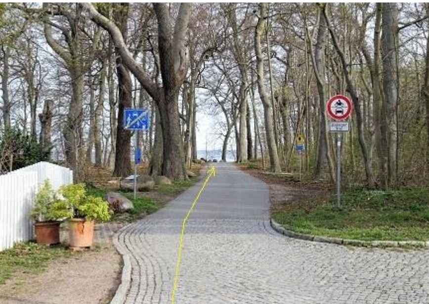
„Am Strand“ -