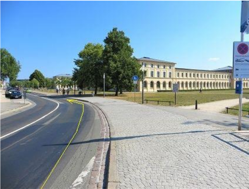
Werderstraße - rechts Marstallgebäude