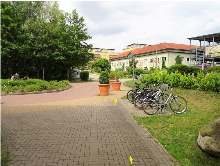
Wendekreis vor Eingangsbereich Haus 3