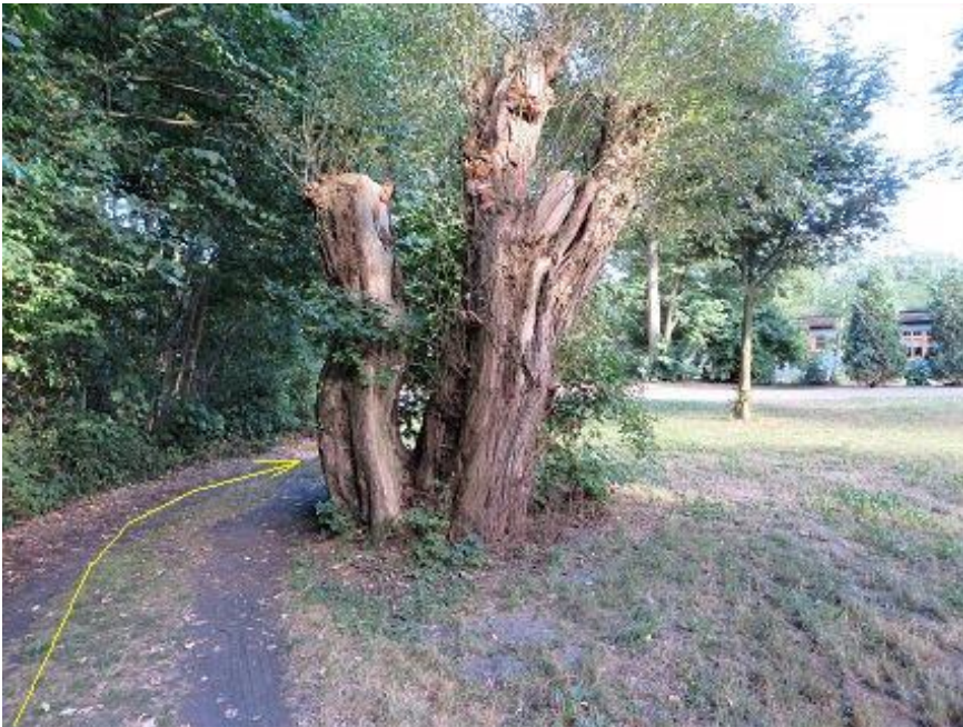
Rastplatz-Dreieck bei Zoogaststätte