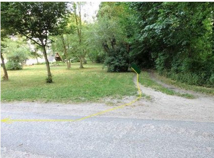
Einbiegung auf „Hexenberg“