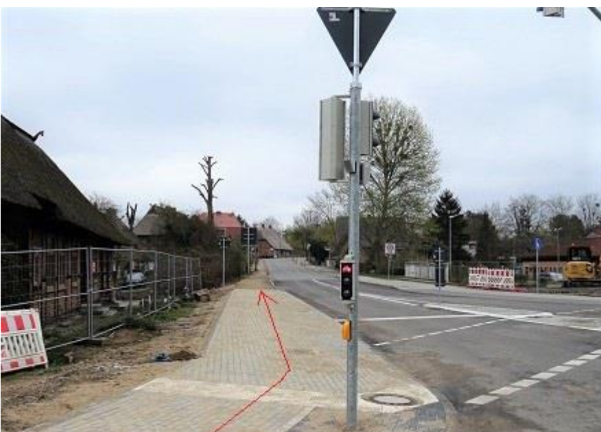
Alte Crivitzer Landstraße -