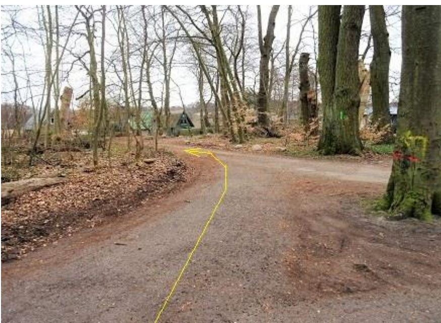
Linksabbiegung zum Uferweg