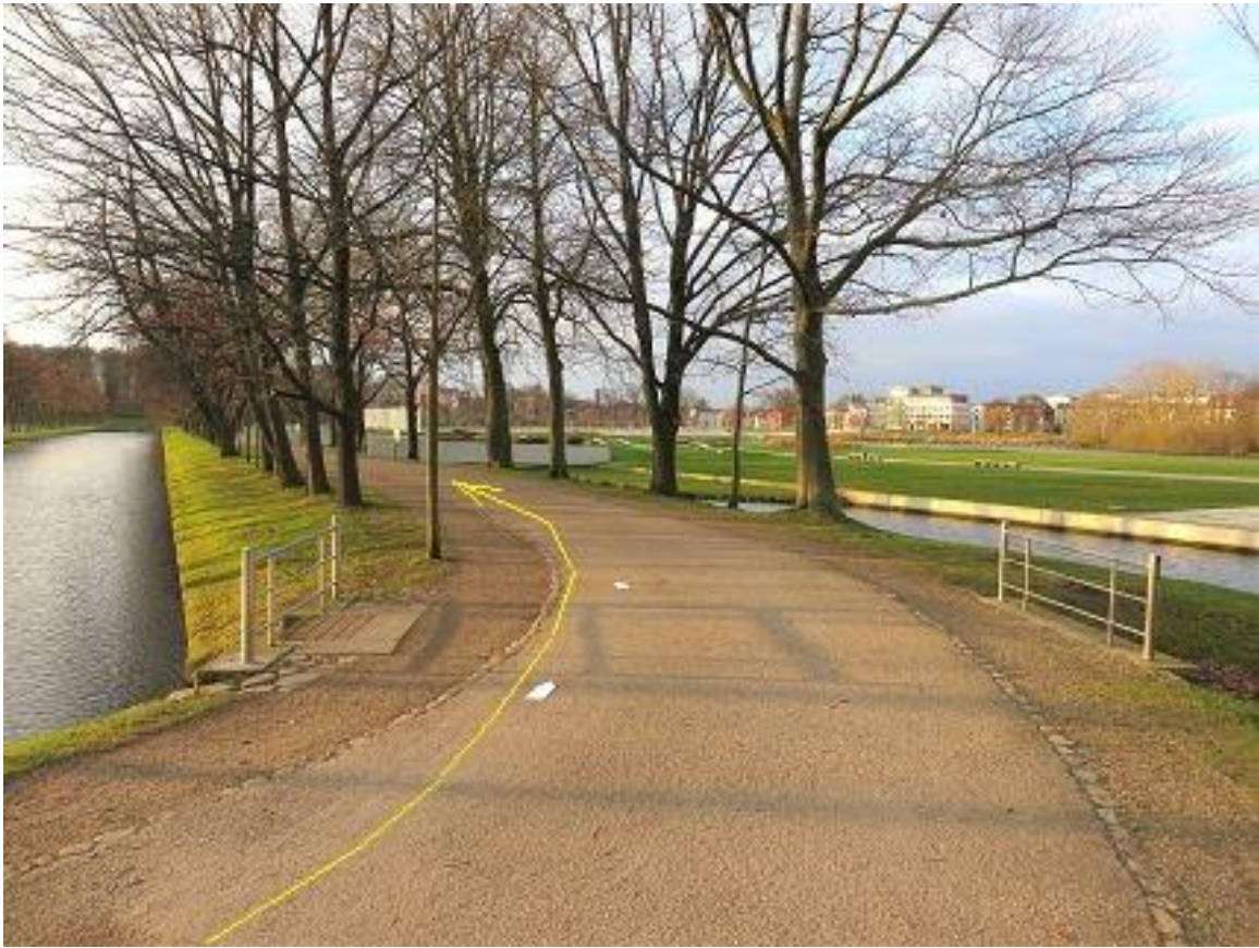
Burgseestraße - mit Blick auf die „Schwimmende Wiese“.