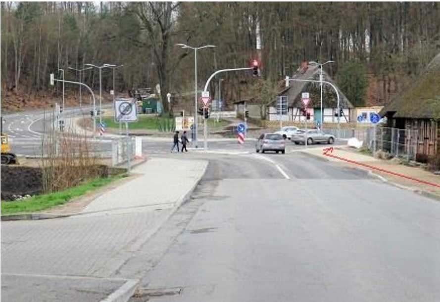
Alte Crivitzer Landstraße - Höhe Netto